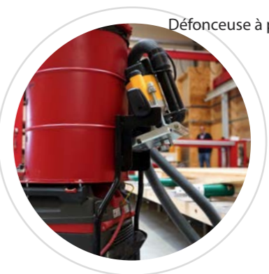
Support Facile à ranger et toujours prêt à l'emploi