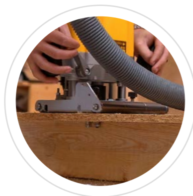
Roulement à bille Automatiquement à fleur avec l'ossature