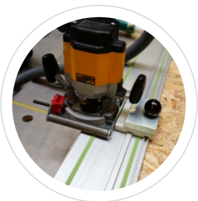
Adaptateur rail Pour une coupe libre avec la même machine